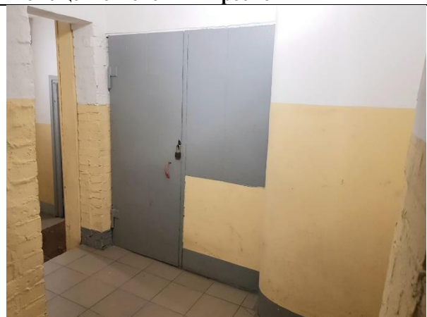
Фото 4. Доступ