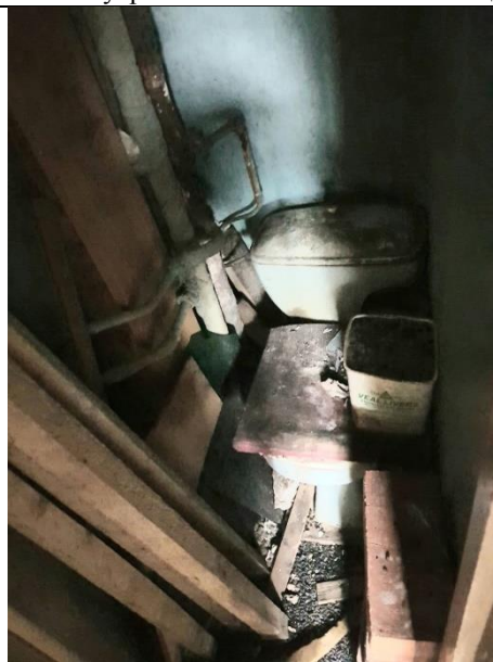
Фото 10. Внутреннее состояние Объекта оценки