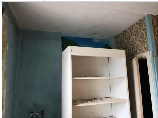
Фото 6. Внутреннее состояние Объекта оценки