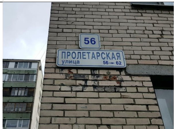
Фото 2. Табличка с номером дома