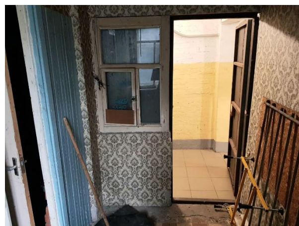
Фото 9. Внутреннее состояние Объекта оценки