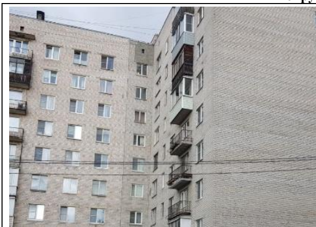
Фото 1. Вид здания, в котором расположен Объект оценки

Общий вид здания, в котором расположен Объект оценки, придомовой территории и ближайшего окружения