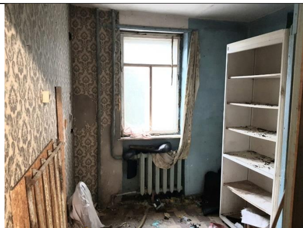
Фото 8. Внутреннее состояние Объекта оценки