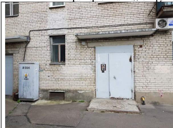
Фото 3. Общий вход со двора