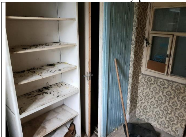
Фото 5. Внутреннее состояние Объекта оценки