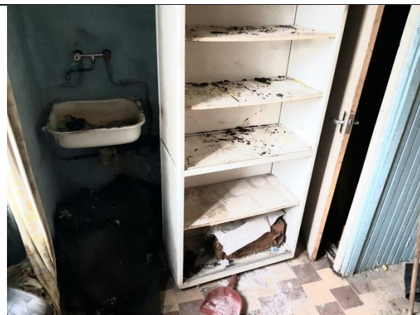
Фото 7. Внутреннее состояние Объекта оценки