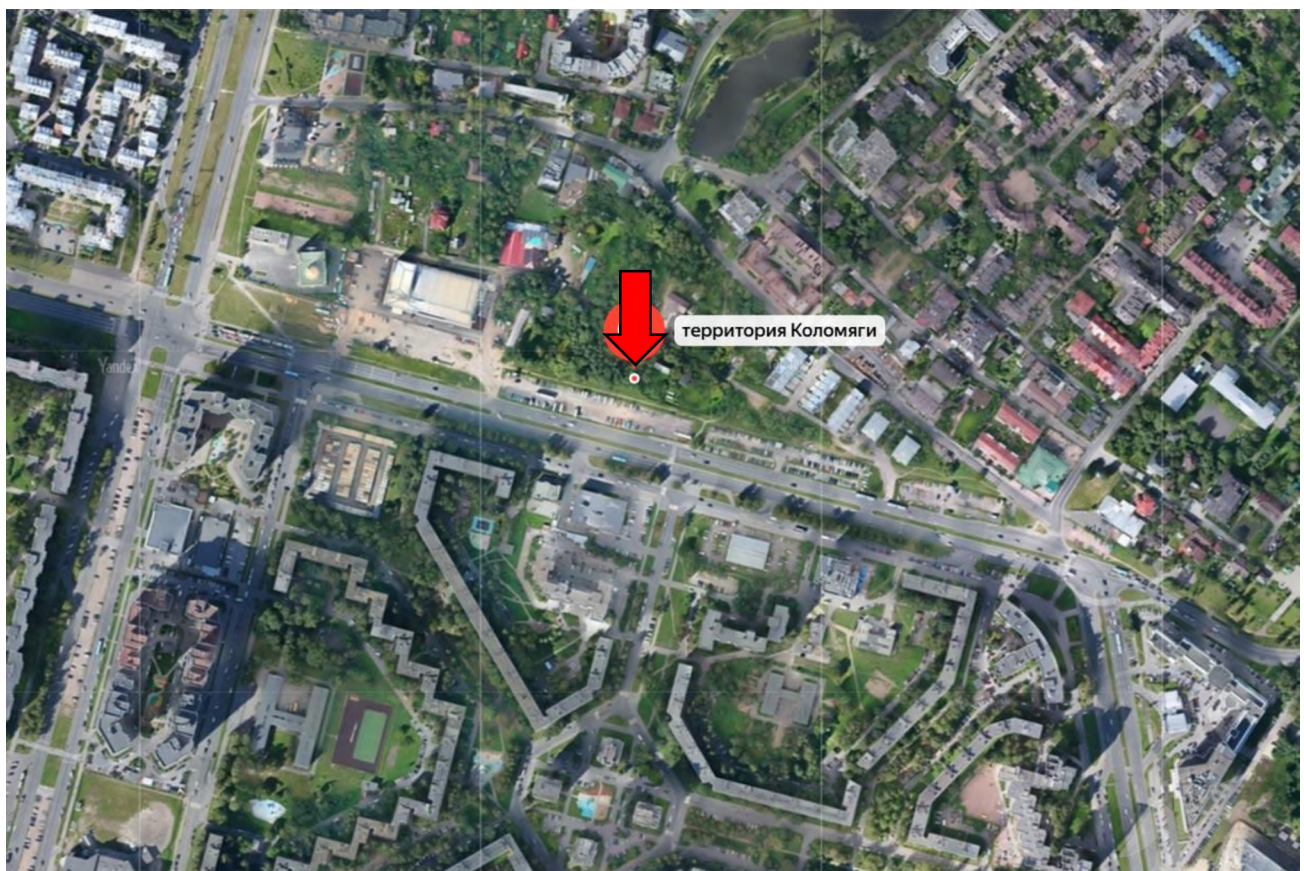
Рисунок 3 – Местоположение оцениваемого земельного участка на карте города