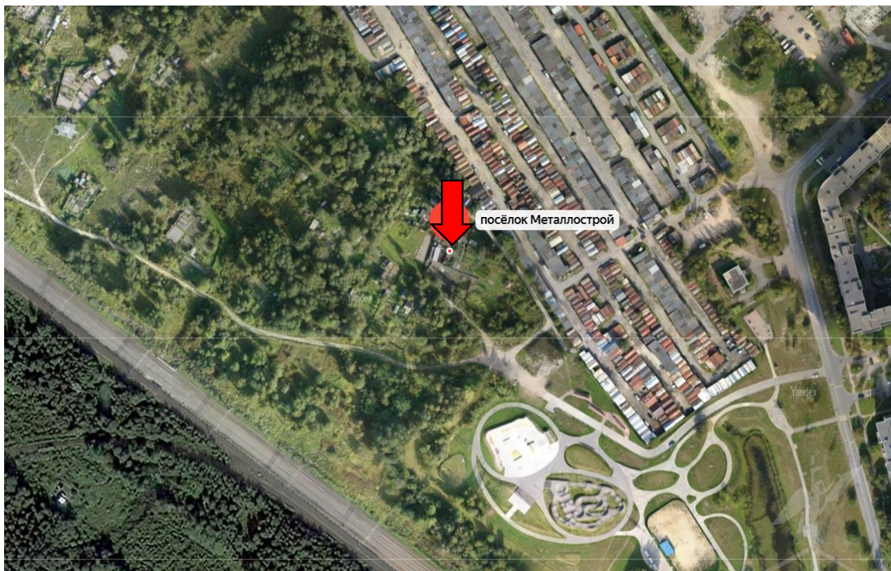
Рисунок 3 – Местоположение оцениваемого земельного участка на карте города